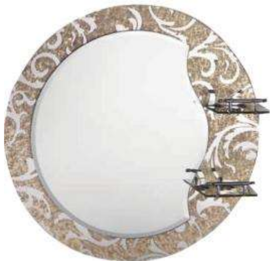
Зеркало Фрап F655